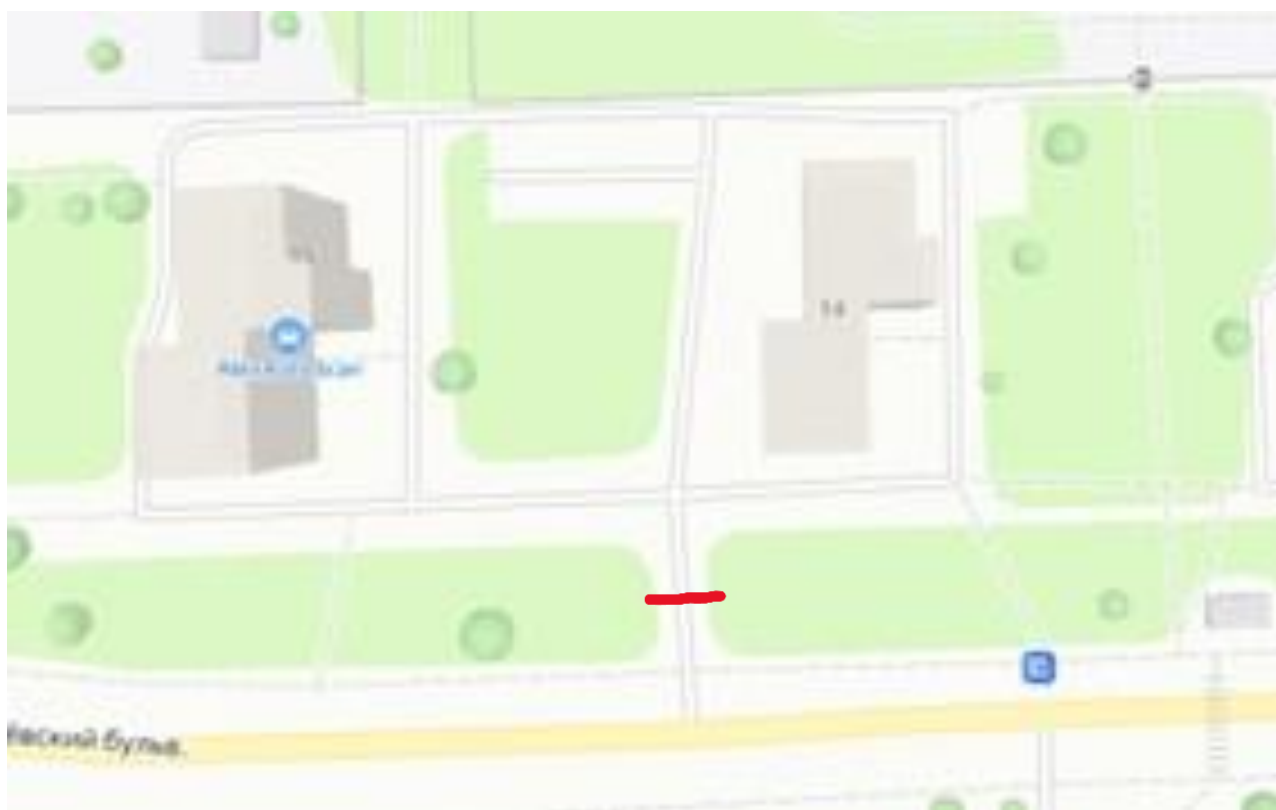
Схема размещения шлагбаума